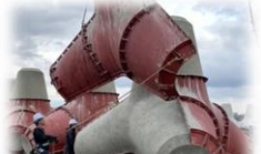
テトラポッド型枠