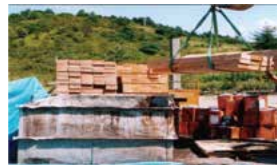
ディッピング塗装